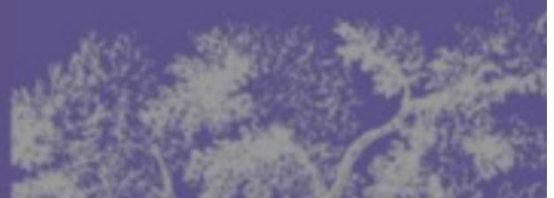
Table Ronde Intelligence