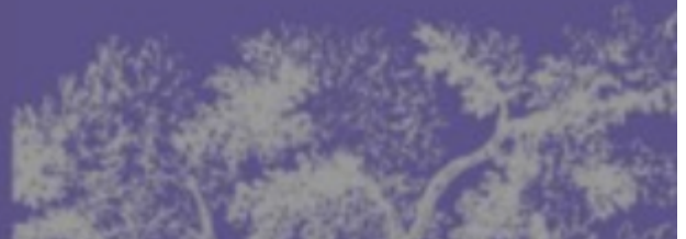
Table Ronde Intelligence