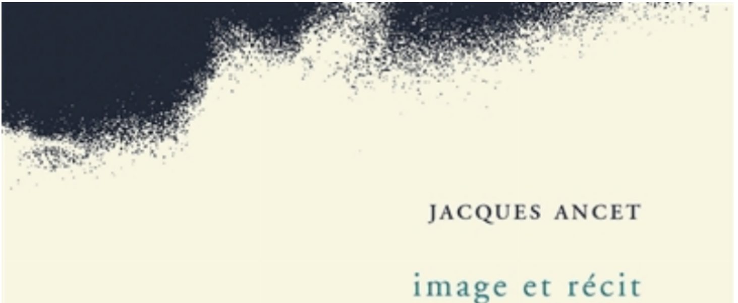
Image et récit de l'arbre et des saisons