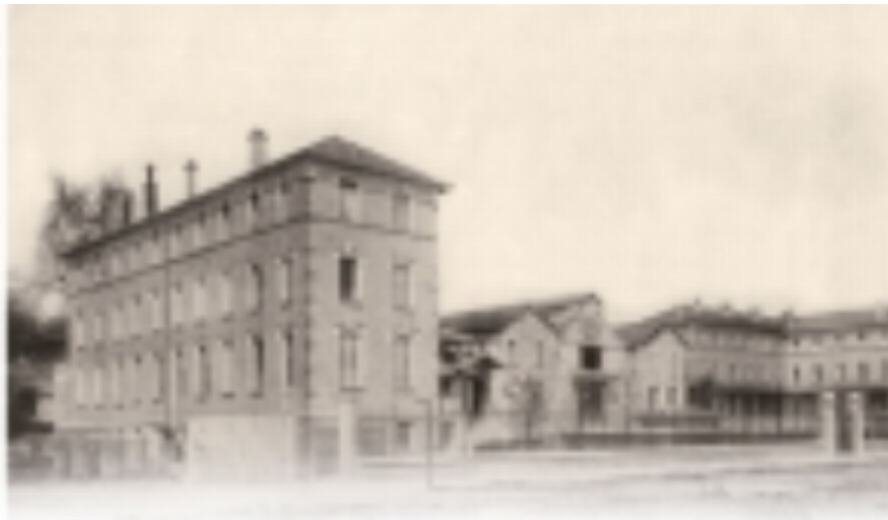
Saint Charles à Juvisy-sur-Orge