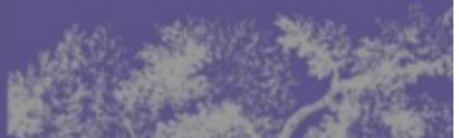
Table Ronde Intelligence

Cahiers du Cercle Nicolas Andry : philosophie, épistémologie, art, chirurgie. n° 14, Intelligence artificielle. Mémoires et souvenirs : les orthopédistes célèbres