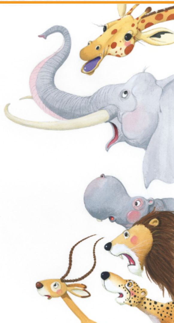
Illustration: Virginie Grosos @ La part du lion, Babouche à oreille

DURÉE DU SPECTACLE : 30 minutes + avec les scolaires intervention de 30 min, à durée adaptable