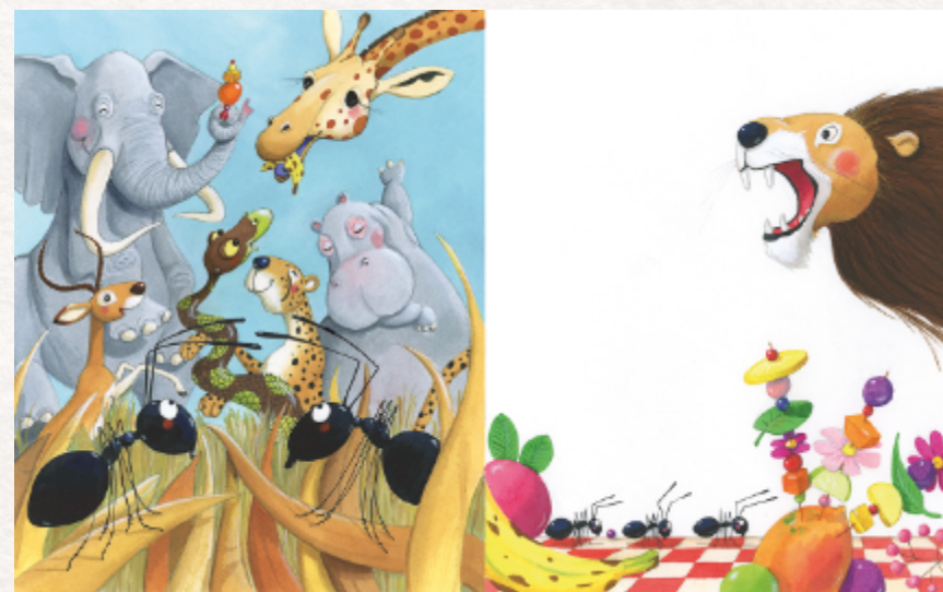
Illustration: Virginie Grosos © La part du lion , Babouche à oreille