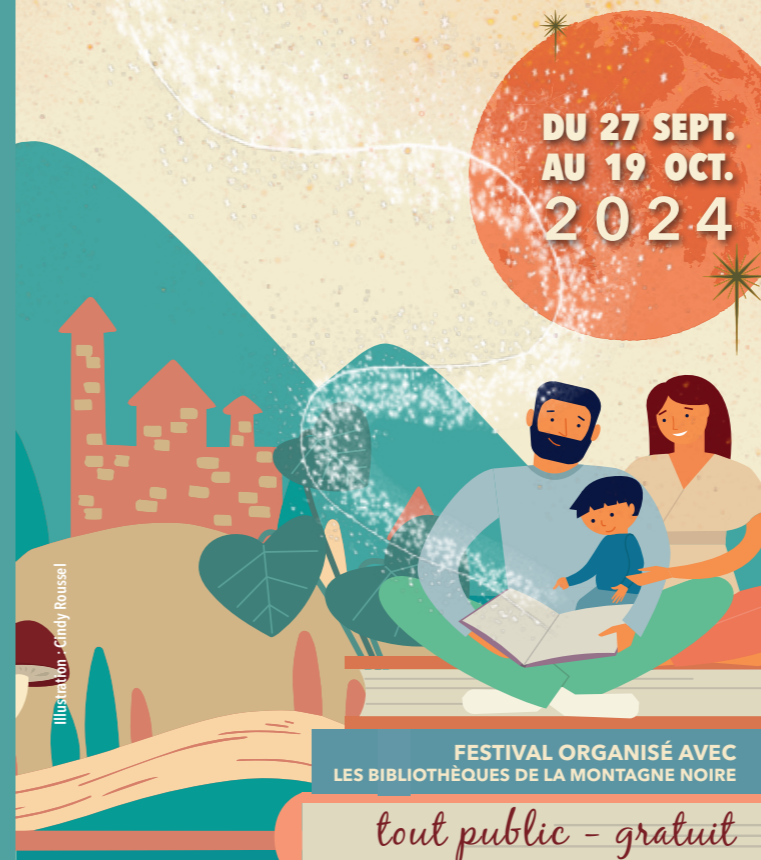
Illustration : Cindy Rousseil

FESTIVAL ORGANISÉ AVEC LES BIBLIOTHÈQUES DE LA MONTAGNE NOIRE