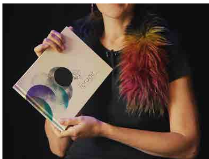
L'orage, Elena Del Vento, éditions MeMo juin 2021

La performance L'orage s'inspire directement de l' album L'orage publié par les éditions MeMo en 2021.