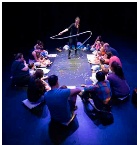
spectacle à réaction libre