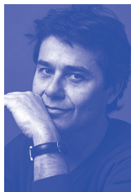
Laurent Binet

Laurent Binet reviendra sur ces romans qui, en prenant souvent la forme d'enquêtes, éclairent à la fois notre passé et notre actualité.