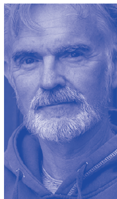
Emmanuel Lepage