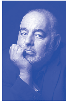
Philippe Jaenada

Philippe Jaenada et Grégoire Bouillier qui partagent un goût certain pour le fait divers, une pratique souvent humoristique de la digression et la volonté d'écrire sur les autres, mais à partir d'un moi qui se raconte aussi, sont aujourd'hui à la tête de deux œuvres impressionnantes. Cet automne, Philippe Jaenada a publié le portrait des « Moineaux », une bande de jeunes qui ont brûlé leur vie par les deux bouts dans les années cinquante. Quant à Grégoire Bouillier, sidéré et même angoissé par Les Nymphéas , il a entrepris une grande enquête sur les secrets de la série de peintures de Claude Monet.