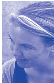
Séverine Chevalier